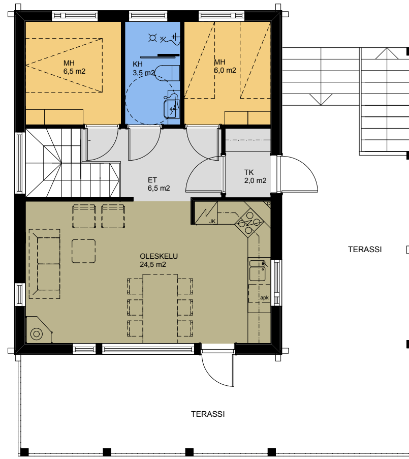
1 kerros B- ja C-talo, D-talo peilaten